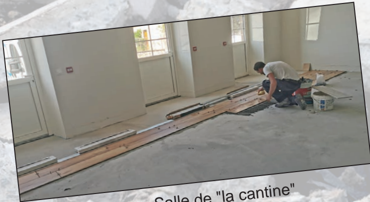
Salle de "la cantine" salle des associations