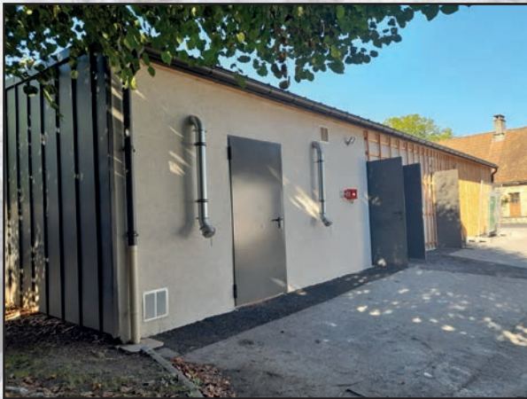
Stockage des pellets pour la chaufferie