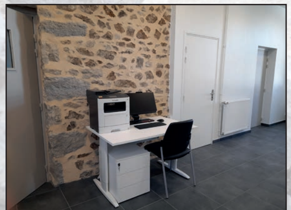
Station de télétravail mis à disposition de chacun.