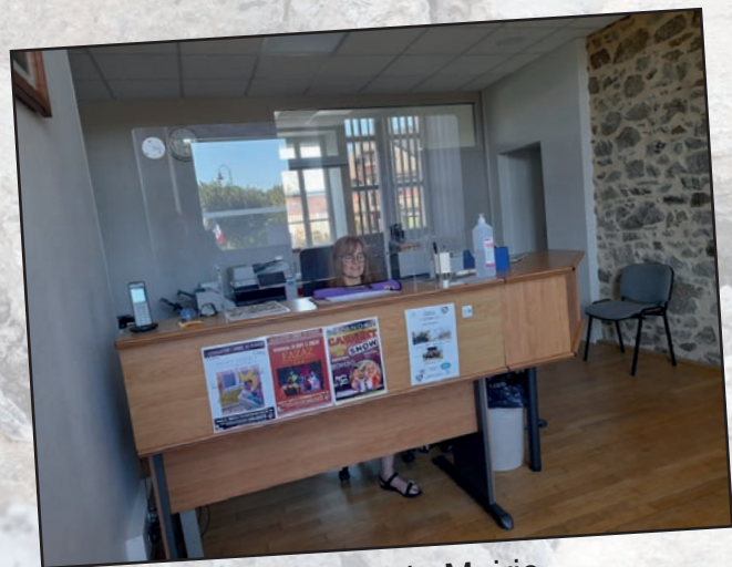
Accueil de la Mairie