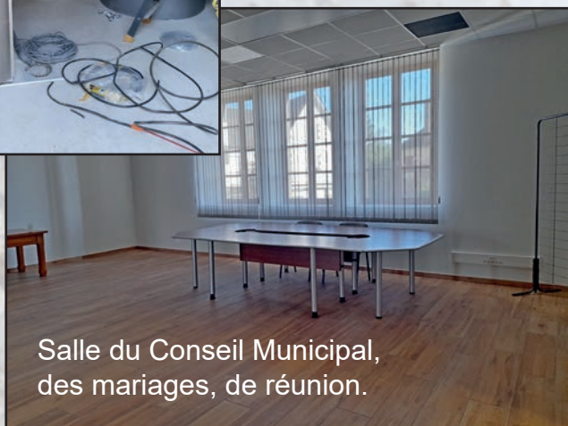
Salle du Conseil Municipal, des mariages, de réunion.